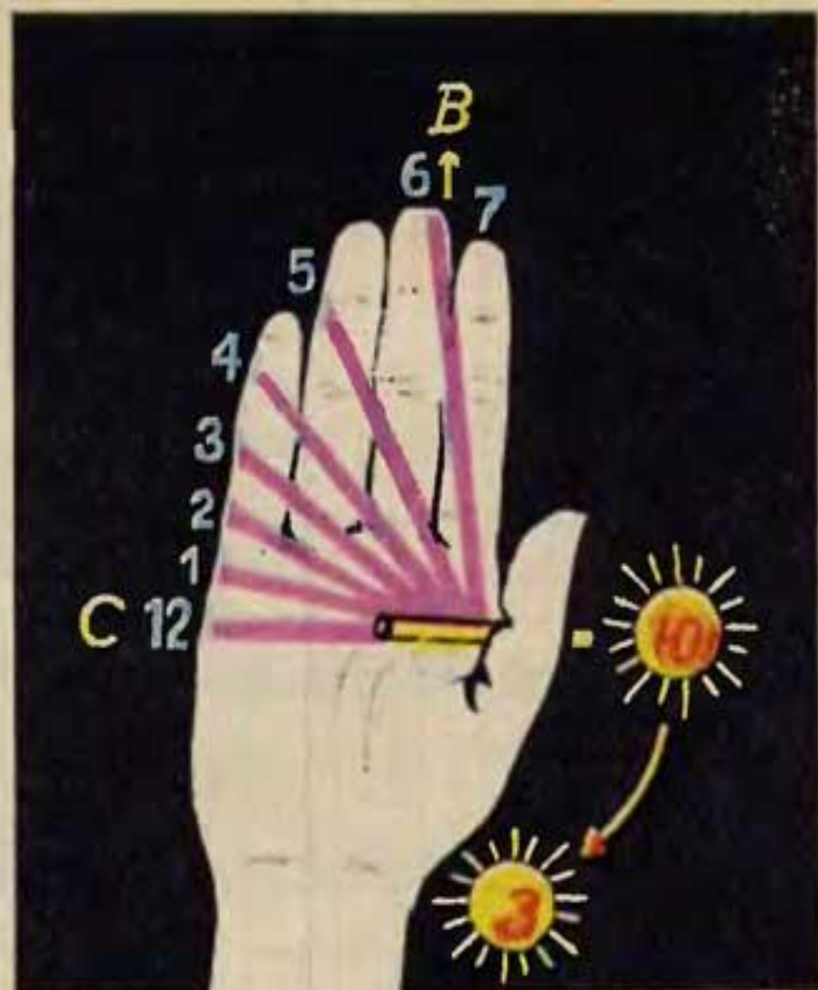
Рис. 2. «Циферблат» наших часов после 12 часов дня.