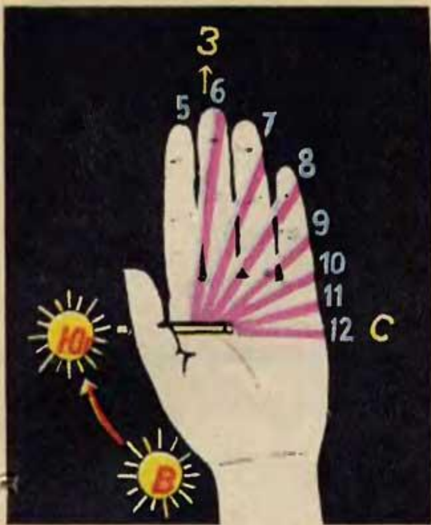
Рис. 1. «Циферблат» наших солнечных часов в первой половине дня. Линии показывают как падает тень «стрелки» в разные часы.