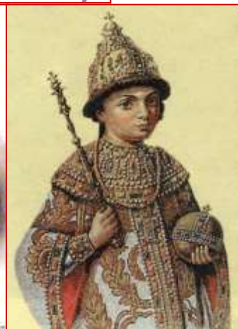
Петр Алексеевич Романов (1682-1725)