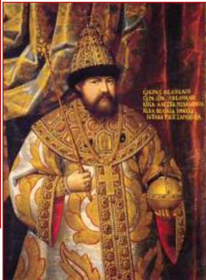
Алексей Михайлович Романов (1645-1676)