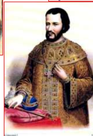
Иван Алексеевич Романов (1682-1696)