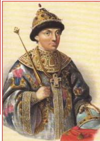
Федор Алексеевич Романов (1676-1682)