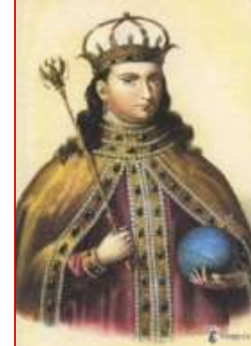
Царевна Софья Алексеевна (1682-1689)