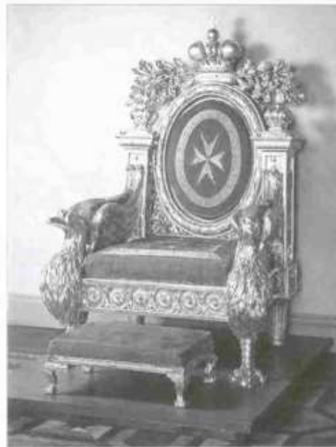
Кресло Великого Магистра Мальтийского Ордена с подножной скамейкой. По рисунку Дж. Кварезми