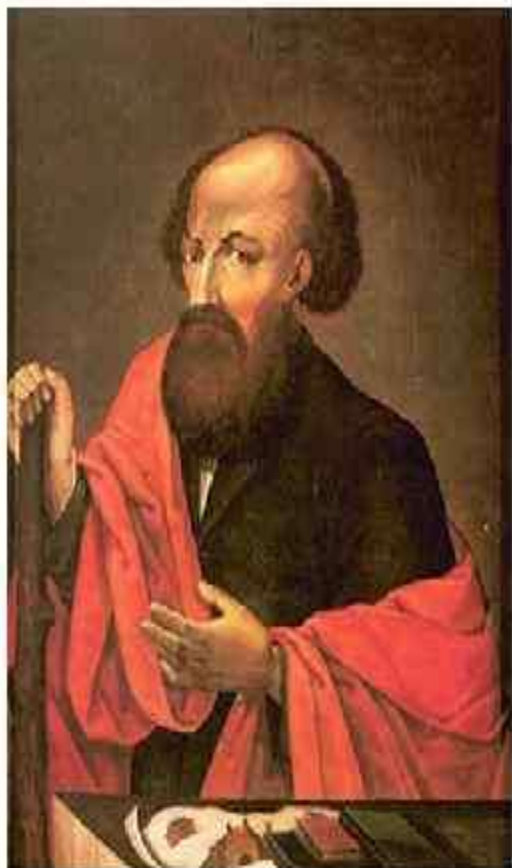
Основатель династии заводчиков Демидовых Никита Демидов сын Антуфьев (1656–1725).

В 1702 г. Петр подарил Невьянский завод Никите Демидову (Антуфьеву), тульскому кузнецу-оружейнику, поставлявшему в армию ружья, качеством не уступавшие иностранным, но стоившие в 12 раз дешевле.