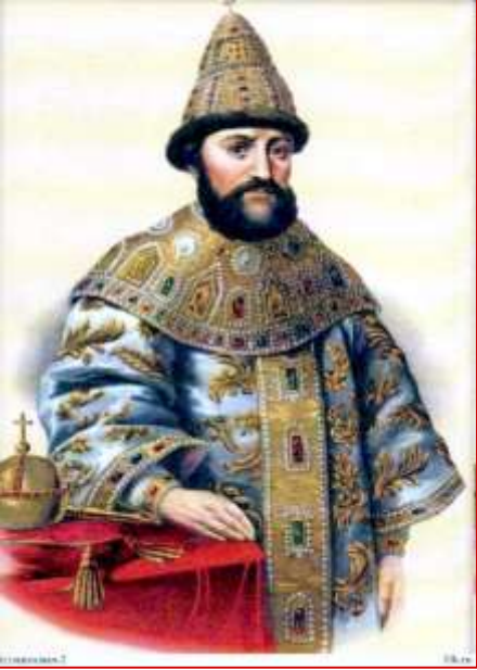
Михаил Федорович Романов (1613-1645)