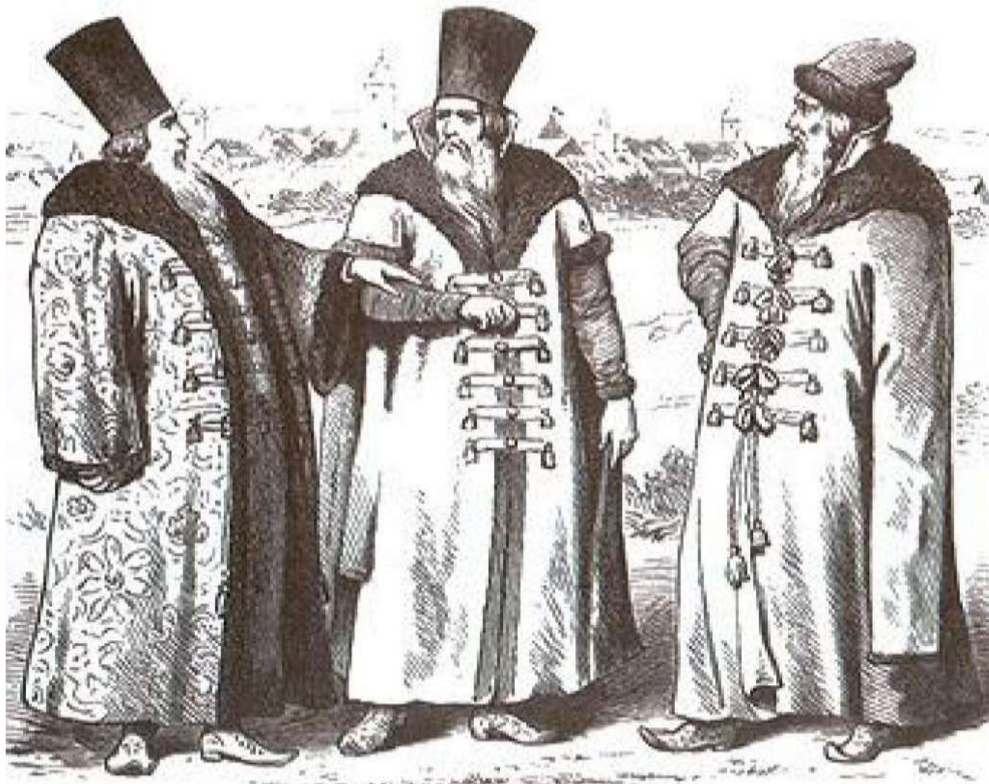
Русские бояре XVI-XVII вв.