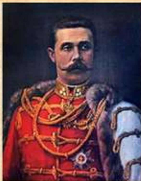
Эрцгерцог Франц Фердинанд