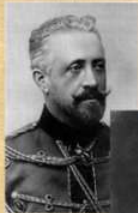
Великий князь Николай Николаевич