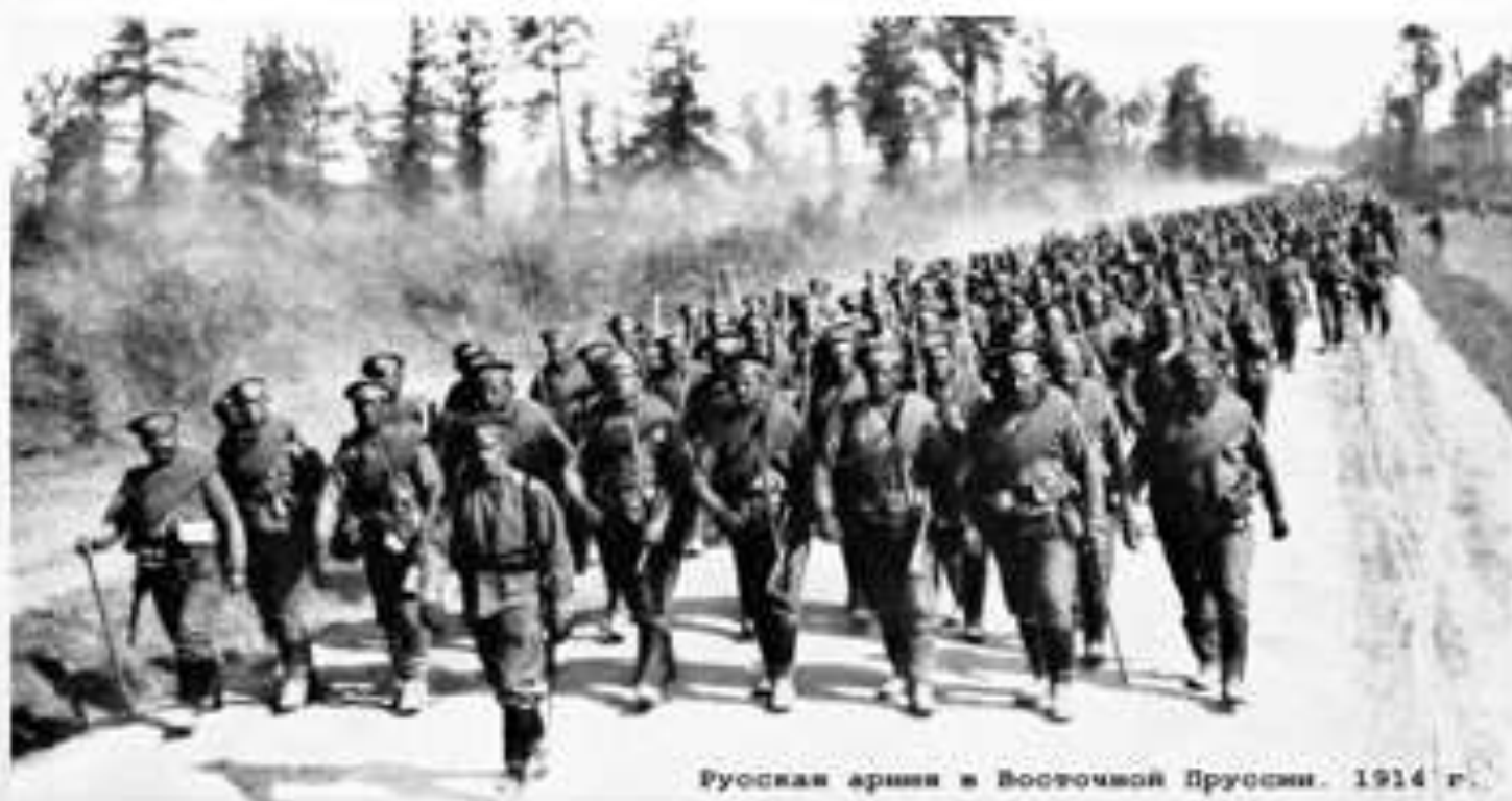
Русская армия в Восточной Пруссии. 1914 г.