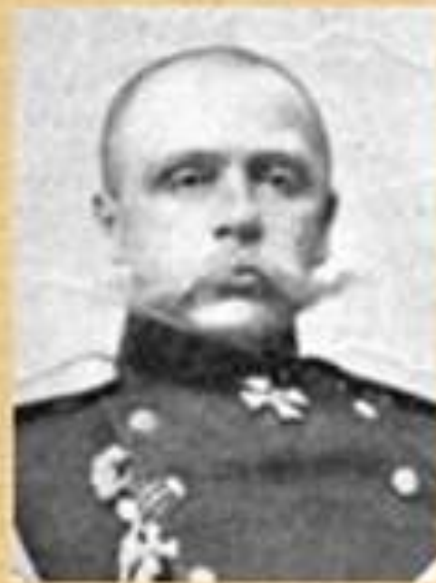
РЕННЕНКАМПФ Павел- Георг Карлович фон