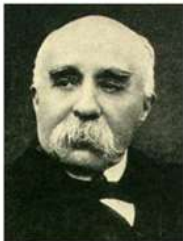
Жорж Бенжамён Клемансо