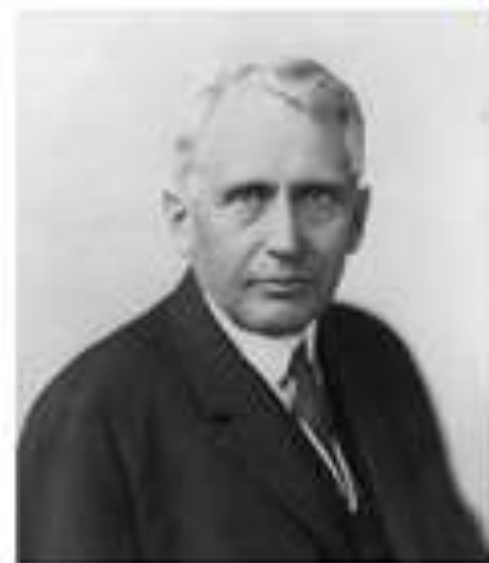
Гос.секретарь США Ф.Келлог