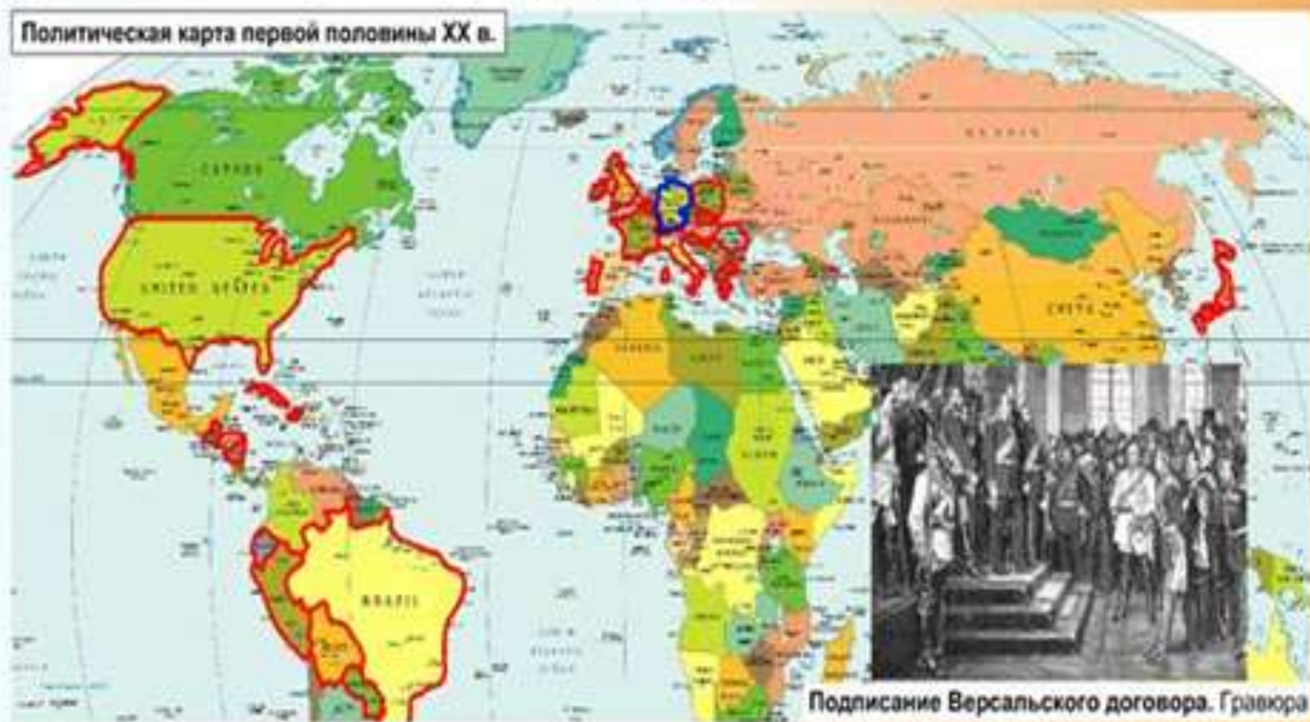
Подписание Версальского договора. Гравюра