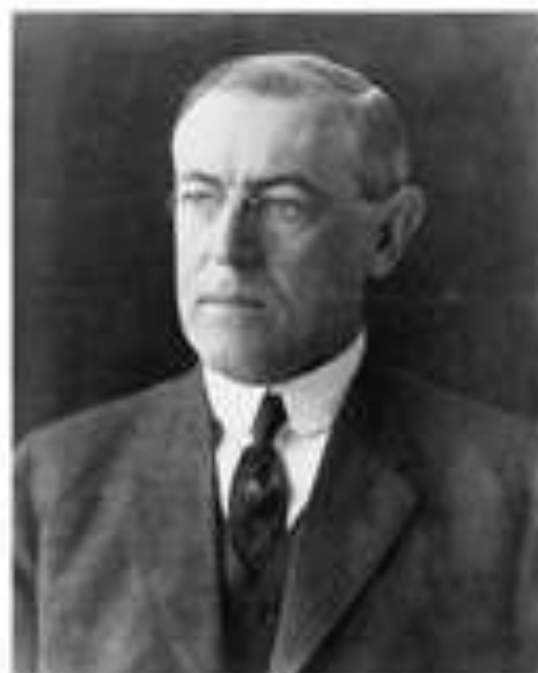
Томас Вудро Вильсон