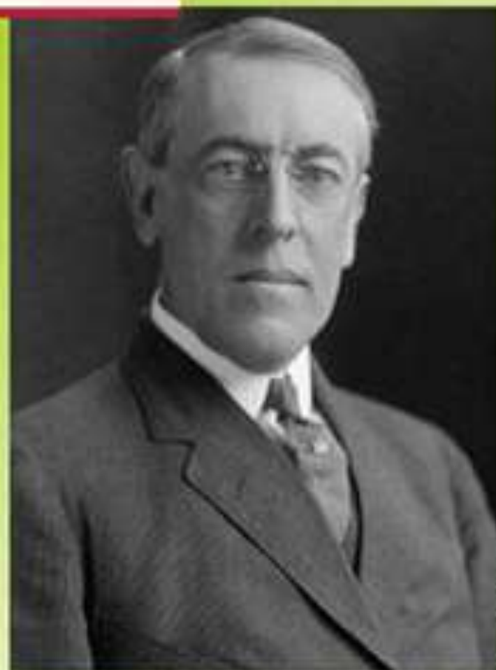
Президент США Вудро Вильсон.

Документ «14 пунктов» В. Вильсона. Программа новой организации мира, впервые была озвучена в послании Конгрессу США 18.01.18г