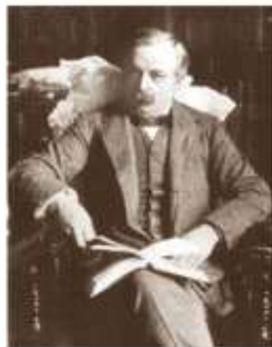
Дэвид Ллойд Джордж