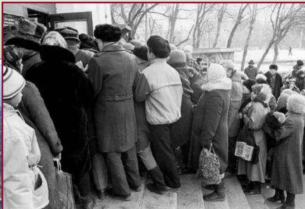
Очередь в винный магазин.

В мае 1985 г. началась борьба с пьянством и алкоголизмом. Производство спиртного сократилось в 15 раз. Это имело отрицательные последствия: на 67 млрд. руб. сократились поступления в бюджет страны, вырублены виноградники, распространилось самогоноварение, сократились запасы сахара.