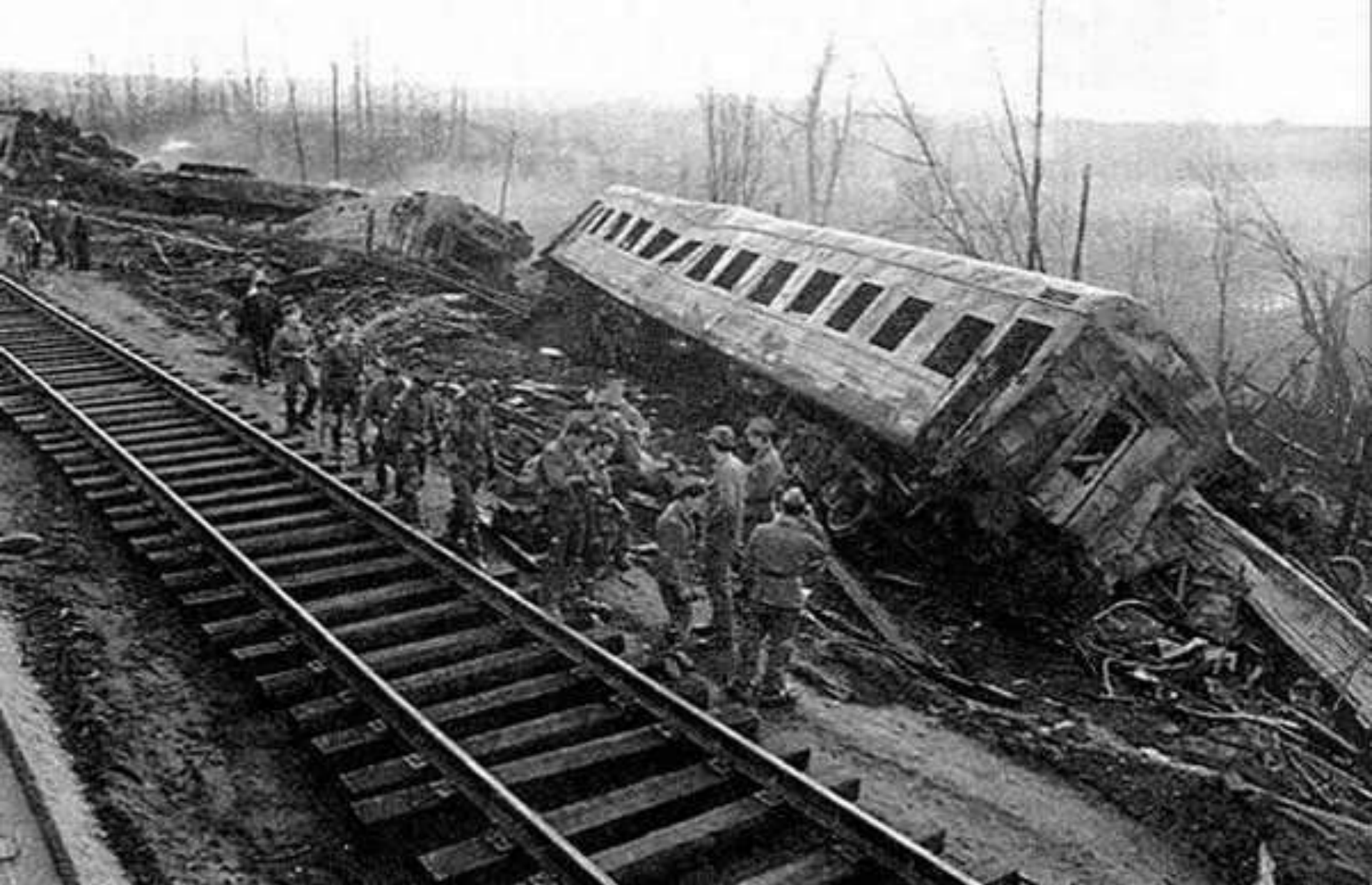
Ашинская катастрофа, июнь 1989г . Погибло около 600 человек, 181 из них –дети.