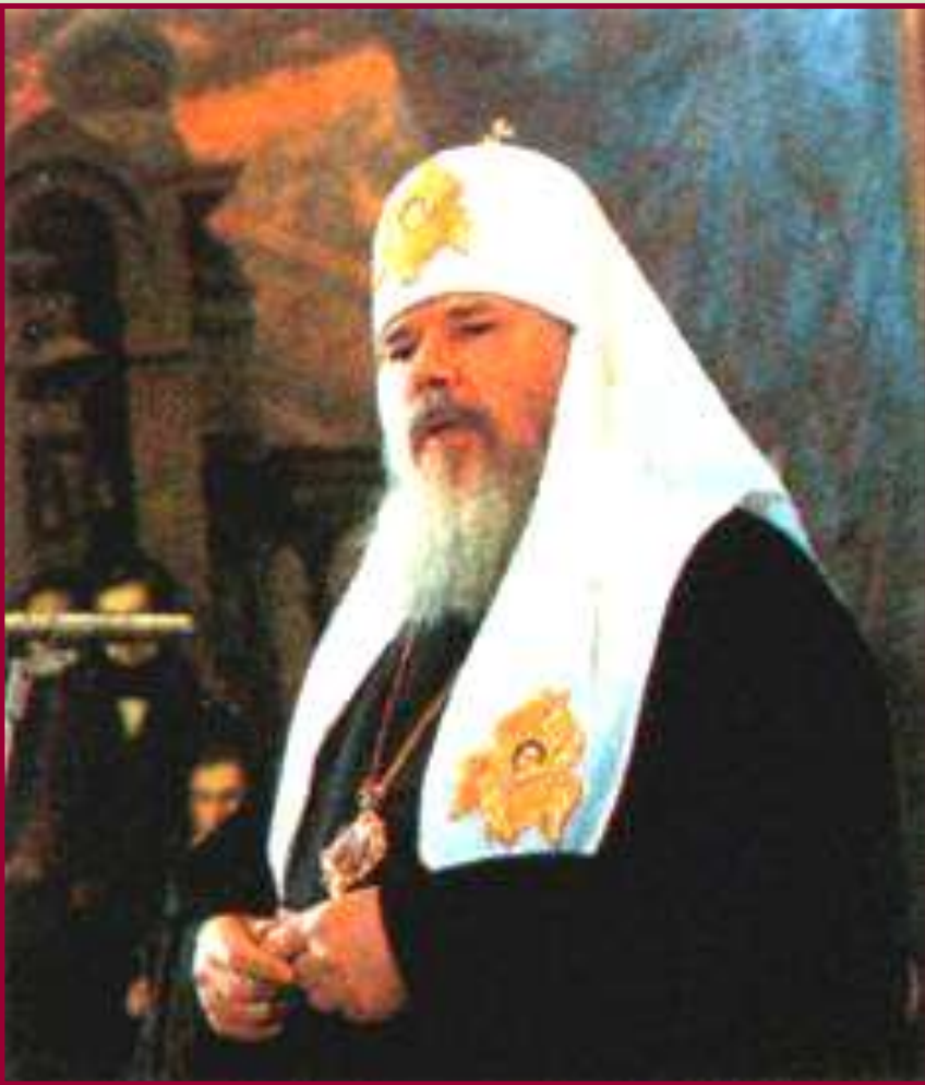
Патриарх Алексий II.

Начавшаяся демократизация общества привела к изменению отношений государства и церкви. Началось возвращение верующим культовых зданий, были сняты ограничения на церковные обряды.