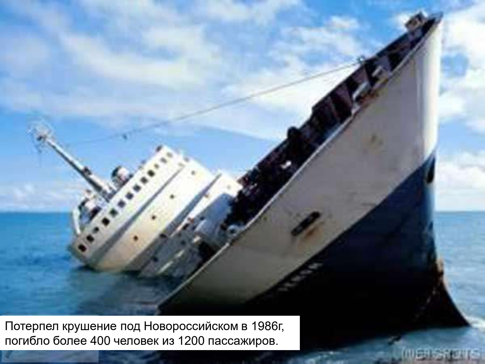
Потерпел крушение под Новороссийском в 1986г, погубило более 400 человек из 1200 пассажиров.