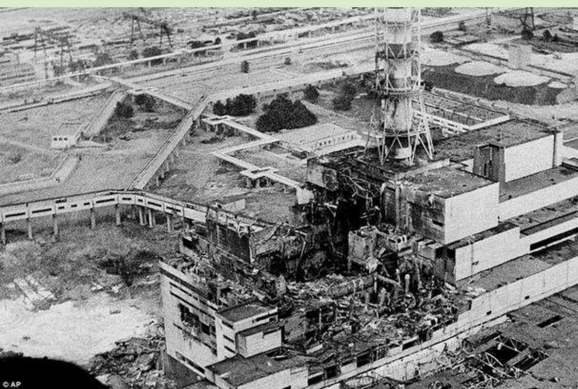
Авария на Чернобыльской АЭС, 1986г.