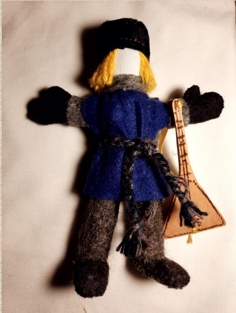
Кукла Иванушка с балалайкой