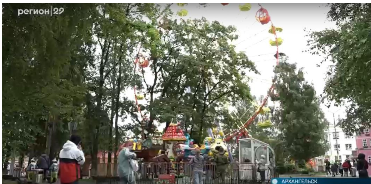
Рис. 2 Кадр из репортажа «200 кругов колеса в день и новый аттракцион: архангельскому Детскому парку – 50.»

Рассмотрим на примере репортажа (Рис. 2) о 50-летию парка аттракционов «Потешный двор» [2].