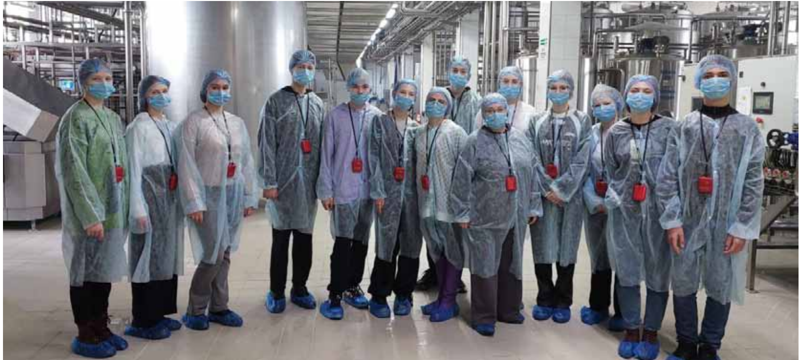
➤ На производстве все должно быть чисто и ничего лишнего

Тем временем экипированные юнкоры отправляются в путь. Первым делом попадаем в молоко-