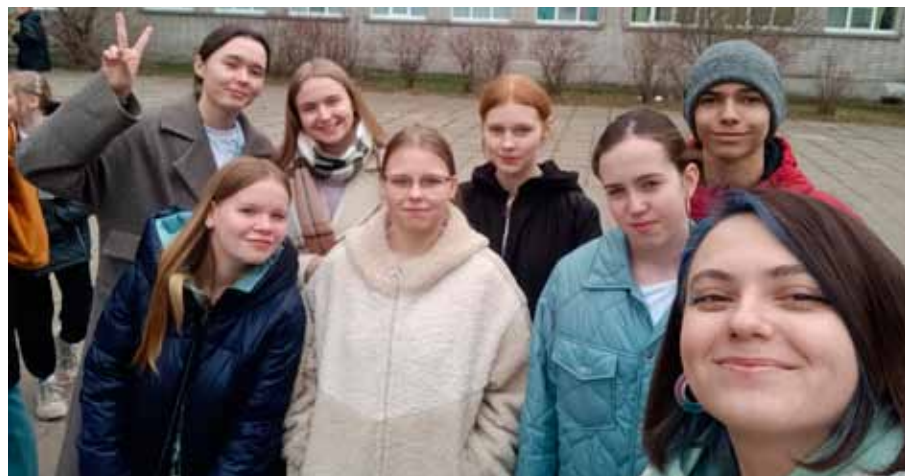
➤ Представили Ассоциацию школьных СМИ на форуме ребята из школы № 10, гимназии № 24 и Детского издательского центра СДДТ. Всего в объединение входят 15 школьных медиацентров.

Его посвятили 15-летию детской организации «Юность Архангельска» и Дню детских общественных объединений.