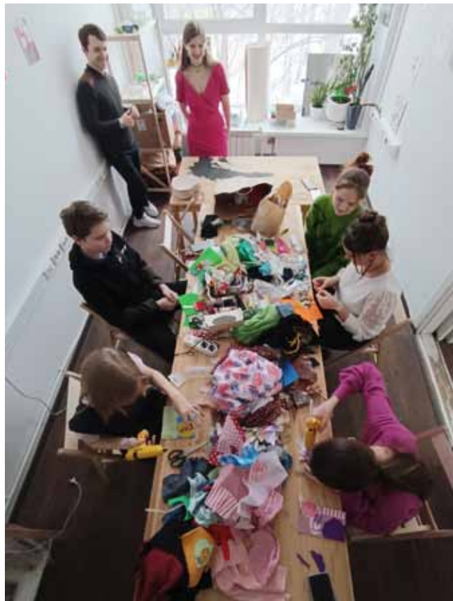
➤ Юные журналисты пробуют себя в лоскутном шитье.

После наш новый знакомый продолжил рассказ о направлениях работы ЦСИ, показывая на стене, где только что сверкала и двигалась зигзагообразная фигура, фотографии с мероприятий.