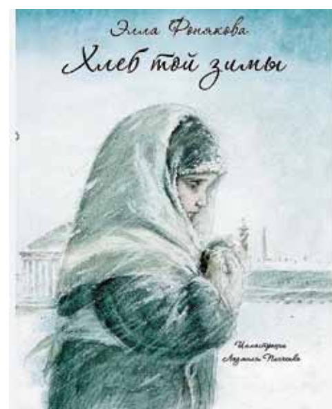
«Хлеб той зимы», 1971, автор Элла Фонакова (6+)

Известие о начале войны застало семью Вовки на даче, откуда им приходится отправиться обратно в Ленинград. Тринадцатилетний подросток почти не расстроен, ведь в городе его ждет масса приключений. Недавно началась война, а Вовка с Женькой