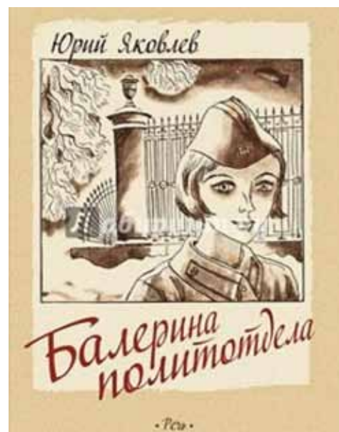
«Балерина политотдела», 1977, автор Юрий Яковлев (12+)

Лена, уже размышлявшая о том, что она проведет сегодня время с родителями, узнает, что началась война. «Что такое война?» –