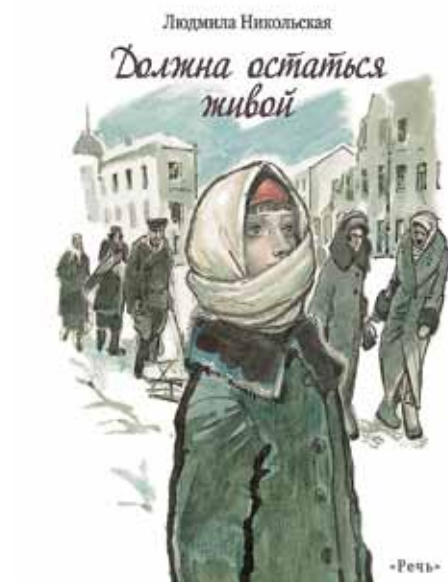
«Должна остаться живой», 2019, автор Людмила Никольская (12+)

уже мечтают попасть на фронт. Но до настоящих бойцов им еще расти и расти! До этого мальчишки и представить не могли, что в Ленинграде будет ничуть не легче, чем на передовой. Так наступает время попрощаться с беззаботным детством, наивными фантазиями и повзрослеть.