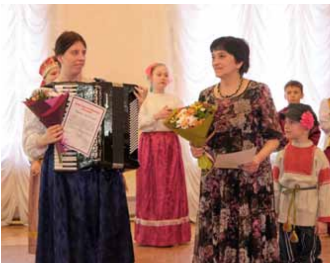
➤ Почти все концертные номера были посвящены России и Архангельску.