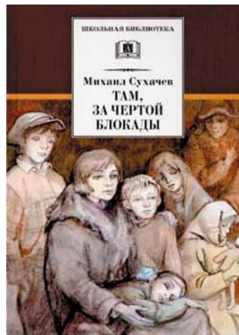
«Там, за чертой блокады», 2015, автор Михаил Сухачев (12+)

Деревня, тетя Катя, нескончаемое парное молоко... Но вдруг Майю будит мама: пора идти за хлебом, иначе раскупят весь, в блокадном Ленинграде его мало. Повесть «Должна остаться живой» – это пронзительная история о жизни детей в блокадном Ленинграде. Автор подробными описаниями мастерски передает атмосферу тех страшных дней, когда голод, холод и бомбардировки становились постоянными спутниками жизни. Повесть рассказывает о нескольких ужасных днях зимы 1941 года из жизни Майи, которой всего 11 лет. История о детях, которые, несмотря на невыносимый голод, старались помогать другим людям.