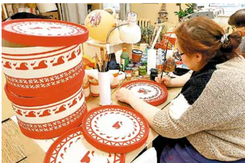
➤ Мастеров ничто не может отвлечь от кропотливой работы.

– Это игрушки для детей, но их делали еще и как обереги. Вот, например, Тяни-толкай – двуглавый конь. В нем сочетается темная и светлая стороны жизни.