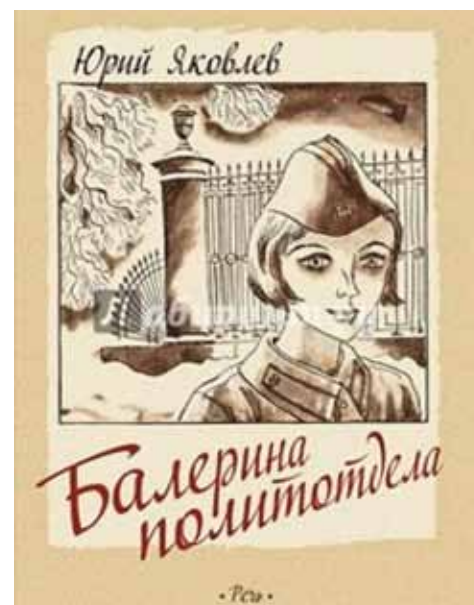
«Балерина политотдела», 1977, автор Юрий Яковлев (12+)

Лена, уже размышлявшая о том, что она проведет сегодня время с родителями, узнает, что началась война. «Что такое война?» –