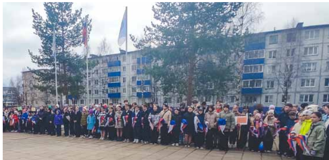
➤ Торжественная линейка-открытие городского форума детских организаций.

Юнкоры Ассоциации школьных СМИ приняли участие в городском форуме