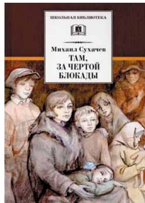
«Там, за чертой блокады», 2015, автор Михаил Сухачев (12+)

Деревня, тетя Катя, нескончаемое парное молоко... Но вдруг Майю будит мама: пора идти за хлебом, иначе раскупят весь, в блокадном Ленинграде его мало. Повесть «Должна остаться живой» – это пронзительная история о жизни детей в блокадном Ленинграде. Автор подробными описаниями мастерски передает атмосферу тех страшных дней, когда голод, холод и бомбардировки становились постоянными спутниками жизни. Повесть рассказывает о нескольких ужасных днях зимы 1941 года из жизни Майи, которой всего 11 лет. История о детях, которые, несмотря на невыносимый голод, старались помогать другим людям.