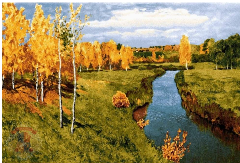
И.И. Левитан «Золотая осень»

Рассмотрите изображение. Определите жанр изобразительного искусства.